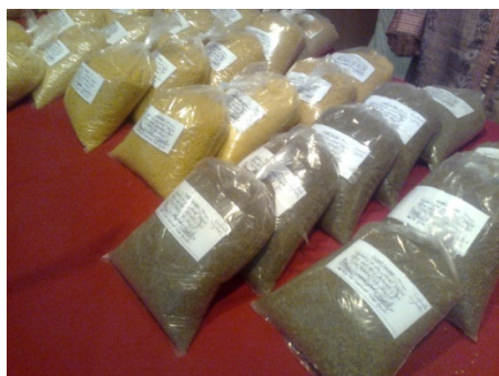
Production de couscous et de miel des coopératives étudiées