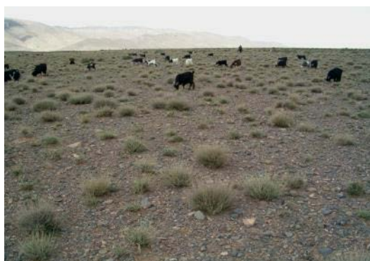
Photo 1. Elevage Caprin sur Parcours