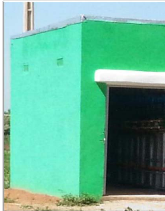
Photos : Prise-borne au niveau d'un bloc d'irrigation et les compteurs à l'intérieur de la prise-borne

Parmi les agriculteurs enquêtés, 12 se sont déclarés insatisfaits des travaux menés pour la réalisation des aménagements externes. La plupart de ces agriculteurs critiquent le fait que l'ensemble des compteurs de chaque bloc d'irrigation (entre 15 et 40) soient installés au niveau d'un seul abri (voir Photos et Figure 2). Ces abris sont fermés, et pour l'instant, seuls les responsables de l'office ont accès aux compteurs situés à l'intérieur de ces abris. Les agriculteurs estiment que cela pourra empêcher les agriculteurs de connaître et de suivre leur consommation en eau.