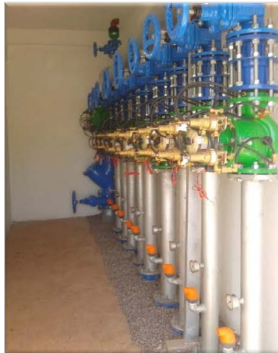
Photos : Prise-borne au niveau d'un bloc d'irrigation et les compteurs à l'intérieur de la prise-borne