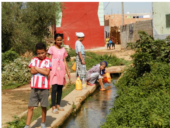
Figure 1 : Jeunes filles et garçons près de la source Ain Amsedar (région du Sais, 2013)

école, loisirs et amitiés, travail, ville et village, jeunesse et sexualité, Makhzen, argent, famille, femme, passé et avenir. Pour mettre en confiance les interlocuteurs, les questions partaient à chaque fois du général au particulier, du vague au plus précis. 44 questions ont été posées pour les 10 thèmes et environ 200 réponses ont été recueillies par questionnaire. Nous présentons dans ce qui suit un résumé des principaux constats et conclusions tirés de chaque thème.