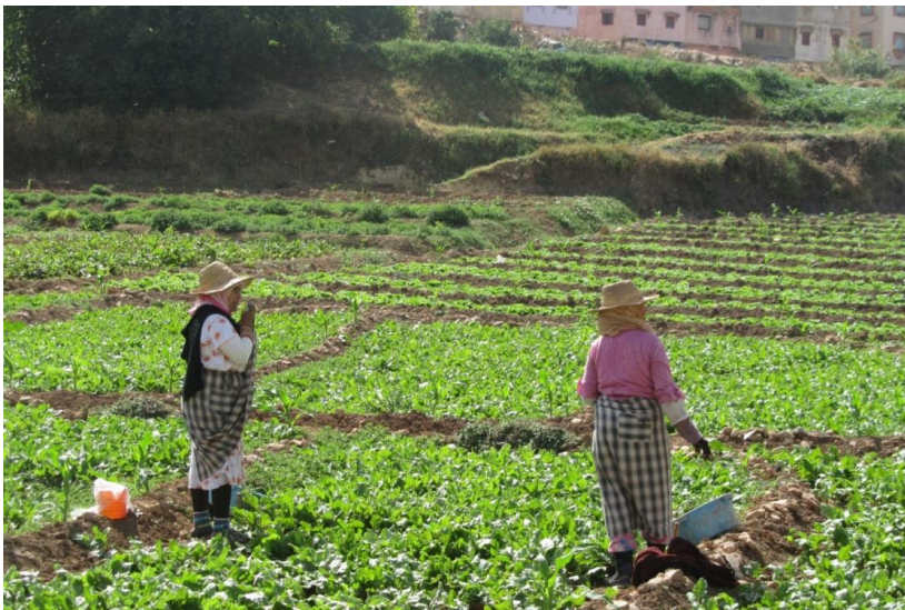
Maraîchères dans la vallée de l'oued Bouisshak derrière le quartier de Sidi Baba (Juin 2013)