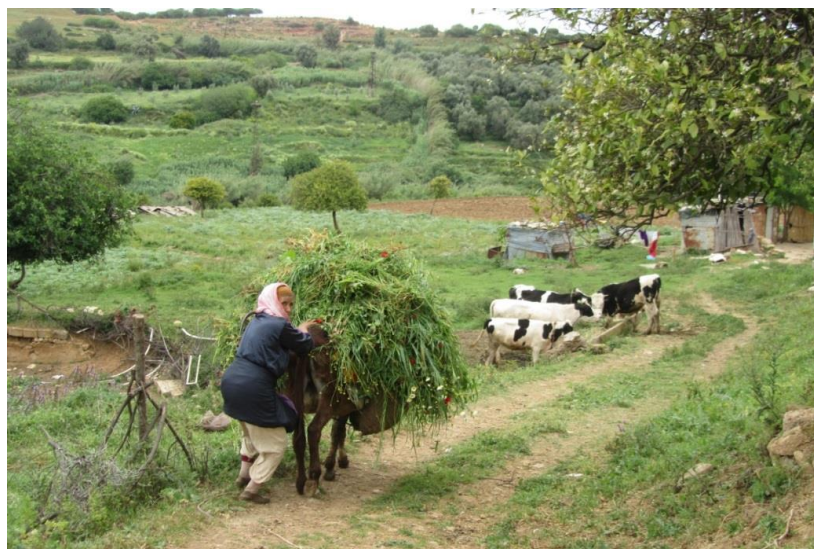
Agricultrice en polyculture élevage dans la vallée de l'oued Ouislane, en aval du quartier de Plaisance (mars 2014)