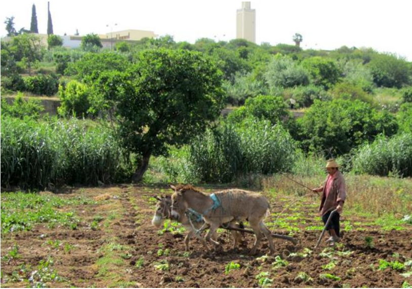
Maraîcher dans la vallée de l'oued Boufekrane près du centre-ville (dans les environs de la maison de la culture et du siège de la RADEM) (mai 2012)