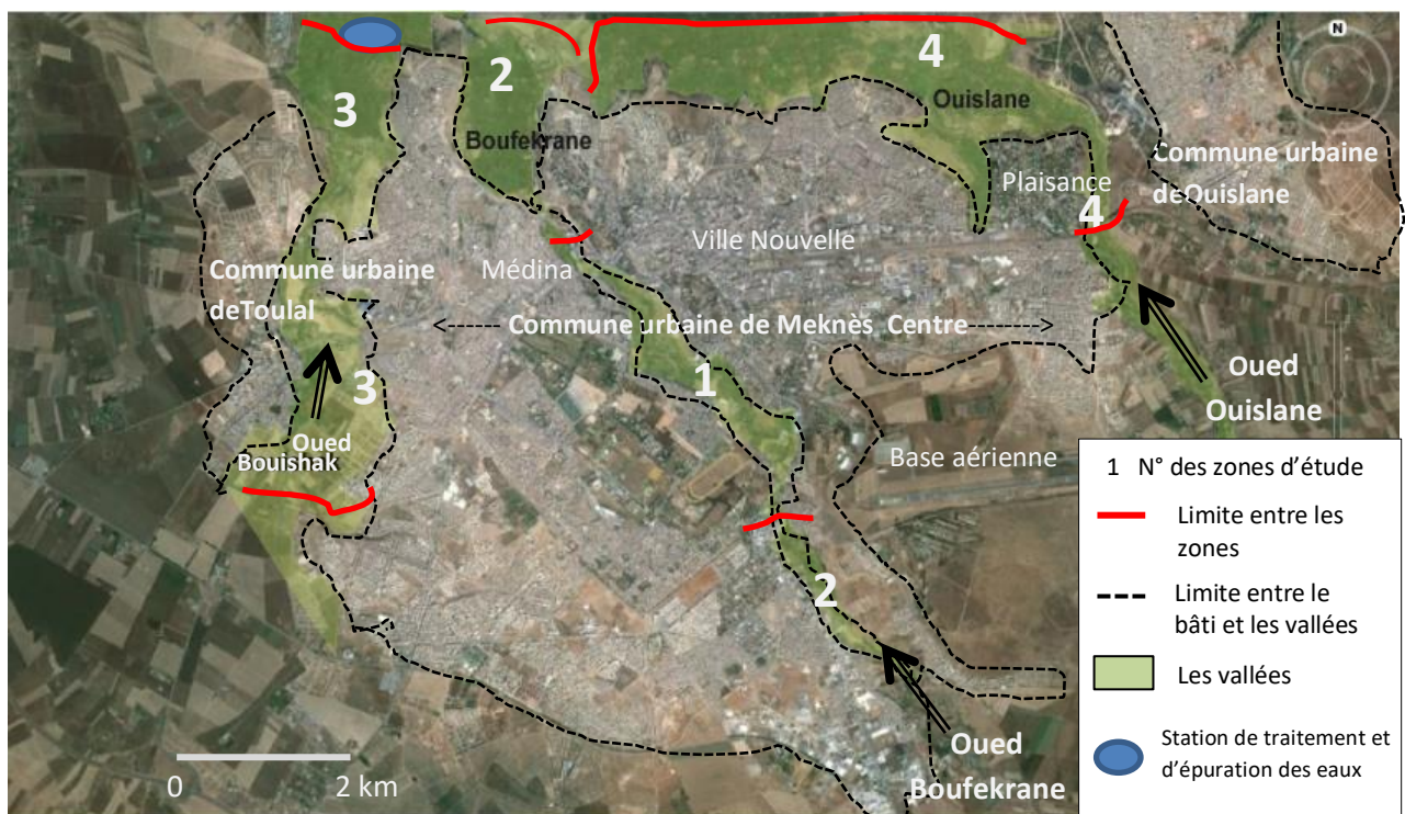
Figure 1 : Localisation des 3 communes urbaines de l'agglomération de Meknès

Meknès est une ville chargée d'histoire, fondée au 9 e siècle et qui a connu son apogée au 18 e siècle durant le règne du Sultan Moulay Ismail. Aux époques Idrissides (9 e et 10 e siècle) et Almoravides (11 e et 12 e siècle), elle s'appelait Meknassa Azaytouna (Meknès les oliviers). La ceinture maraîchère autour de la ville (constituée à cette période de la médina actuelle, le palais royal et ses dépendances) avait une double fonction : alimenter la ville en produits alimentaires rapidement périssables (fruits et légumes) que l'état des routes entre ville et campagnes n'arrivait pas toujours à assurer, et servir d'espaces récréatifs pour les citadins (les Nzaha , sorties récréatives de fin de semaine). Elle bénéficiait des apports d'eau des 3 oueds bien alimentés du fait de la proximité du Moyen Atlas et du Causse pré-atlasique.