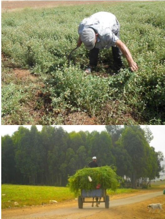
Photos. Séguia d'irrigation, détermination de la biomasse et transfert du bersim dans une exploitation du plateau du Saïs