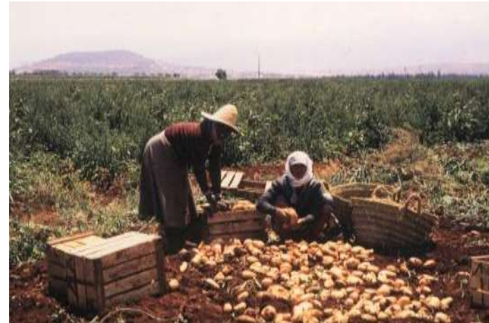
Photo 2. Ramassage des pommes de terre par les femmes