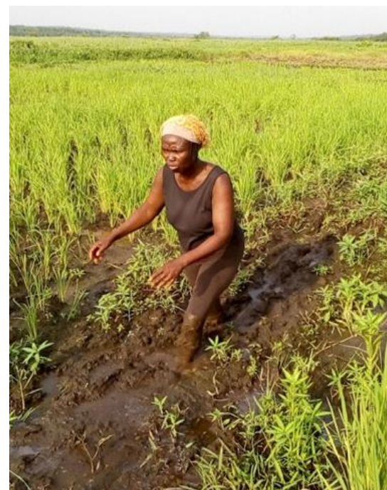
Photo 1. productrice de riz (Glazoué, département des Collines, Juillet 2018)

Le présent article vise à répondre à ces questions et teste l'hypothèse selon laquelle les contrats affectent différemment les hommes et les femmes. Après avoir examiné l'inclusion ou non des femmes aux contrats agricoles, l'article analyse et compare l'impact des contrats sur les riziculteurs hommes à celui des femmes productrices de riz.