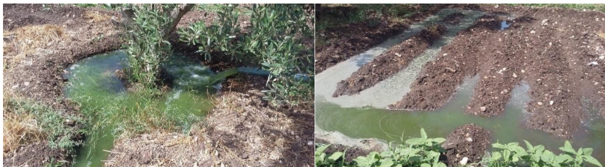
Photos 1. Irrigation en gravitaire d'oliviers et de maïs fourrager, à partir des effluents pompés à l'aide d'une motopompe

station 20 . L'irrigation localisée n'étant pas encore installée, c'est l'irrigation gravitaire qui est aujourd'hui utilisée par ces agriculteurs (cf. Photos 1). De grandes quantités d'eau sont lâchées et l'irrigation s'effectue en continu, toute la journée durant.