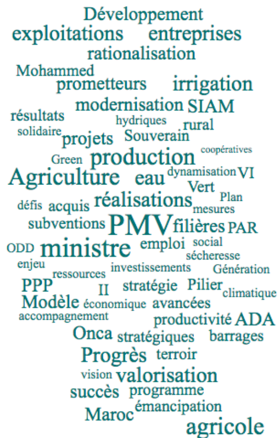
Figure 1: Nuage des principaux mots-clés des articles du quotidien Le Matin traitant du PMV entre 2016 et 2020

Un autre exemple relatif au journal électronique Hesperess (dans sa version arabe) montre que sur les 26 articles étudiés, 2 représentent des analyses rédigées par des enseignants-chercheurs et agronomes et 1 entretien avec