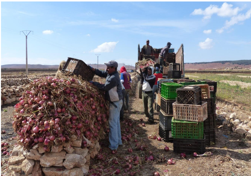
Stockage des oignons sur le Causse entre El Hajeb et Ifrane (octobre 2014)

La diversification du maraichage a été souvent évoquée mais je n'ai pas trouvé de cultures bien adaptées à la région et qui rapportent suffisamment [c'est-à-dire autant que l'oignon]. Dans le temps j'avais essayé le chou-fleur et la tomate. La tomate, j'y pense à nouveau avec une nouvelle variété que j'ai testée cette année. Le chou-fleur est intéressant pour les éleveurs car les feuilles vertes récupérées après la récolte constituent un très bon fourrage. On voit tout de suite l'augmentation de la production de lait.