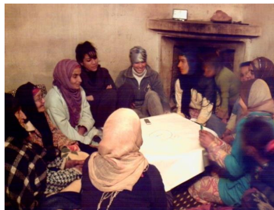
Photos 1 et 2 : Entretien collectifs avec les hommes et les femmes du douar