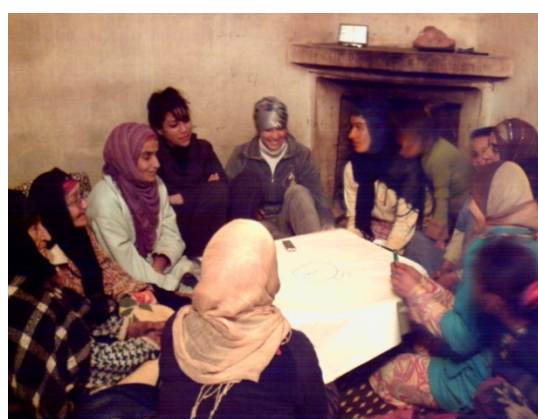
Photos 1 et 2 : Entretiens collectifs avec les hommes et les femmes du douar