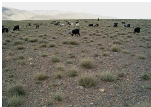
Photo 1. Elevage Caprin sur Parcours

Le diagnostic combine plusieurs outils d'enquête dont principalement les entretiens individuels et les focus groups. Ces focus groups ont regroupé les éleveurs, les agroéleveurs et les membres des conseils administration des organisations coopératives et associatives ainsi que des représentants des communes rurales et des autorités locales à l'échelle des provinces de Settat (zone de El Brouj), de Rehamna (zones de Skhour Erhamna et Ben Guerir), de Chichaoua, de Safi (zone de Chemaia) et la préfecture de Marrakech (zone d'Ouled Dlim).