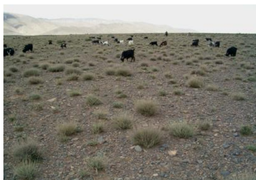
Photo 1. Elevage Caprin sur Parcours