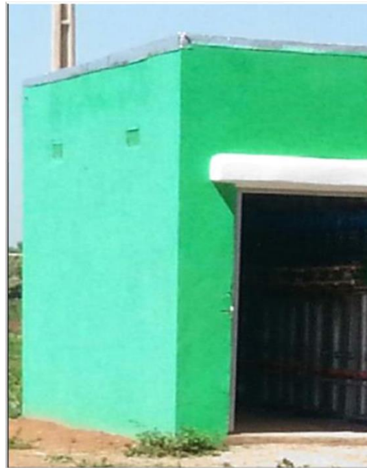
Photos : Prise-borne au niveau d'un bloc d'irrigation et les compteurs à l'intérieur de la prise-borne

Parmi les agriculteurs enquêtés, 12 se sont déclarés insatisfaits des travaux menés pour la réalisation des aménagements externes. La plupart de ces agriculteurs critiquent le fait que l'ensemble des compteurs de chaque bloc d'irrigation (entre 15 et 40) soient installés au niveau d'un seul abri (voir Photos et Figure 2). Ces abris sont fermés, et pour l'instant, seuls les responsables de l'office ont accès aux compteurs situés à l'intérieur de ces abris. Les agriculteurs estiment que cela pourra empêcher les agriculteurs de connaître et de suivre leur consommation en eau.