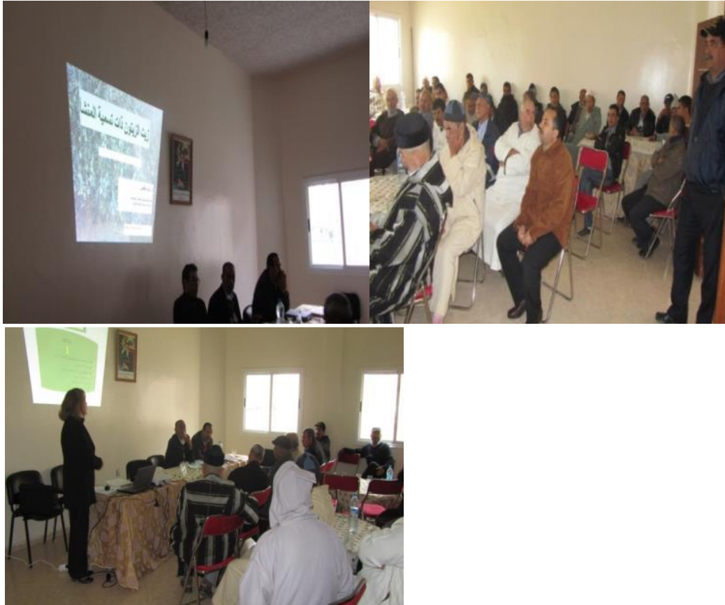
Photo 4 : La formation au processus de labellisation le 21 mai 2013 au niveau de la commune Bni Arouss