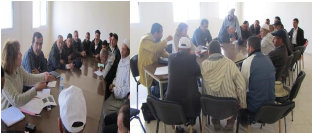
Photo 5: Réunion avec le comité juridique le 29 mai 2013 au niveau de la commune Bni Arouss

En mai 2013, nous avons organisé une troisième journée au niveau de la commune Bni Arouss, avec le Directeur de l'ONCA de Larache et le comité juridique de la future AOP. Après présentation du projet de cahier des charges, certaines modifications ont été apportées. L'ensemble des parties présentes se sont accordées sur chaque rubrique du projet de cahier des charges.