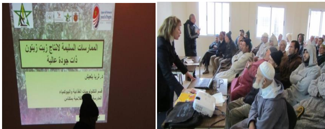
Photo 3. Atelier de Formation aux bonnes pratiques de production le 5 décembre 2012 à Bni Arouss