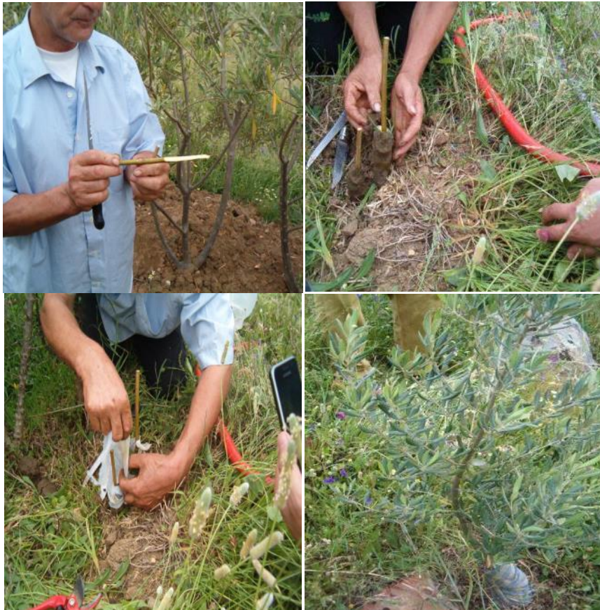
Photo 1 : Les étapes du greffage d'un rameau d'olivier sur un pied d'oléastre, réalisées par un agriculteur du douar Khriba

de Larache ont également observé que les fleurs de l'olivier greffé sur l'oléastre ne tombent pas sous l'effet du vent "Chergui", contrairement aux fleurs d'oliviers plantés directement.