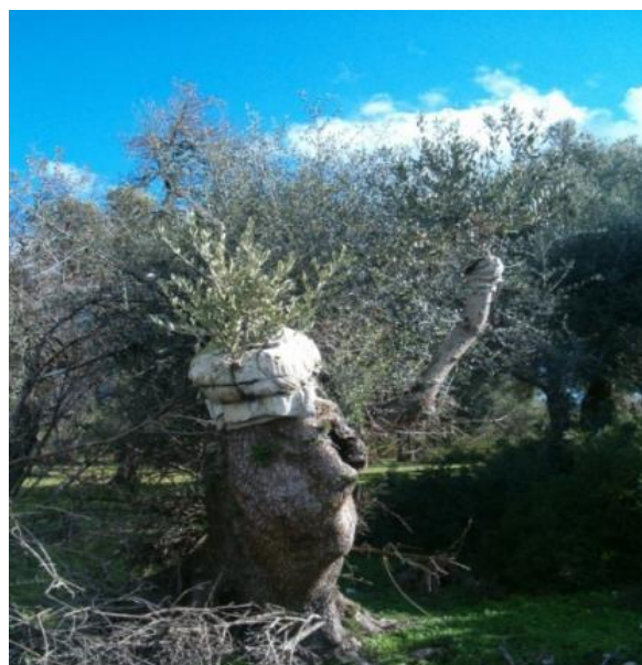
Photo 2 : La préservation d'oléastres centenaires et leur exploitation comme porte greffe