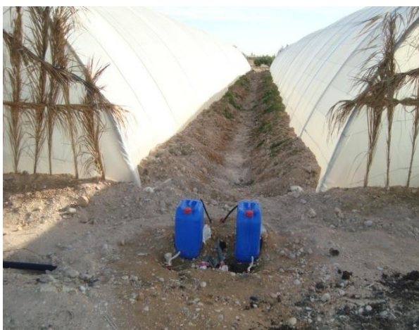
Figure 3b. Dispositif de fertigation innovant dans les serres tunnels