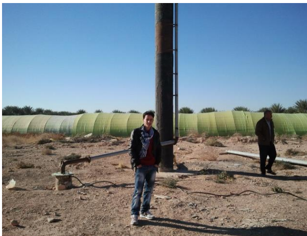
Figure 3a. Dispositif de château d'eau en amont du réseau d'irrigation