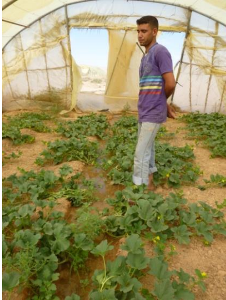
Figure 5 : Jeune agriculteur dans une serre tunnel à El Ghrouss

agriculture en raison de leur ancrage ancestral dans l'élevage et le commerce (Naouri, 2014).