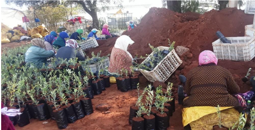
Photo 1. Préparation des plants d'oliviers au niveau de l'exploitation A

Les facilités de déplacement vers l'exploitation agricole demeurent un facteur important pour les femmes ouvrières permanentes et occasionnelles. La femme caporale se charge d'annoncer en avance d'une semaine ou deux aux femmes qu'il y aura du travail dans l'exploitation pour qu'elles se préparent. A chaque fois que les employeurs ont besoin de travailleuses, ils amènent les mêmes femmes des villages qui entourent le lieu de travail. C'est le chauffeur de l'exploitation qui assure le transport après avoir fixé avec elles un point de ramassage.