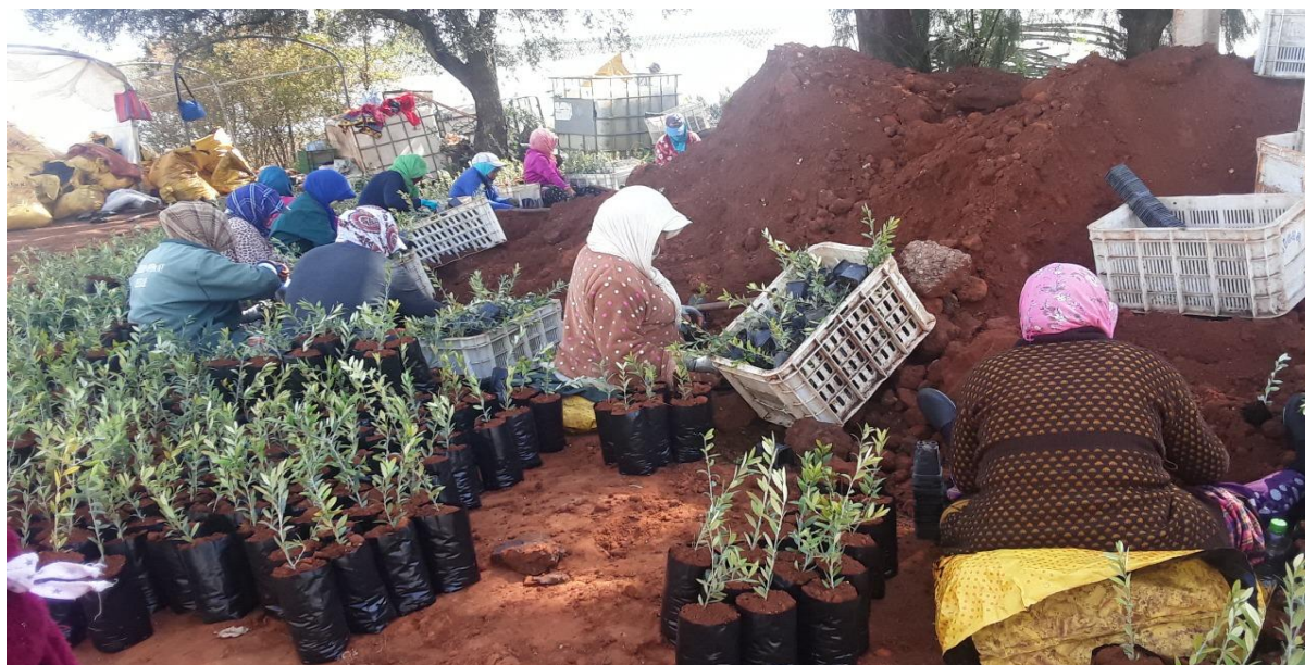
Photo 1. Préparation des plants d'oliviers au niveau de l'exploitation A

Les facilités de déplacement vers l'exploitation agricole demeurent un facteur important pour les femmes ouvrières permanentes et occasionnelles. La femme caporale se charge d'annoncer en avance d'une semaine ou deux aux femmes qu'il y aura du travail dans l'exploitation pour qu'elles se préparent. A chaque fois que les employeurs ont besoin de travailleuses, ils amènent les mêmes femmes des villages qui entourent le lieu de travail. C'est le chauffeur de l'exploitation qui assure le transport après avoir fixé avec elles un point de ramassage.