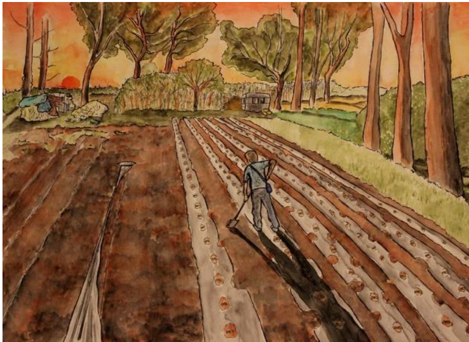
Figure 3. Karim travaillant au coucher du soleil sur son exploitation, Bouches-du-Rhône, 2017

©A.Lascaux, A.Rigaud | Conception : Anne Lascaux – Réalisation : Antoine Rigaud, 2017