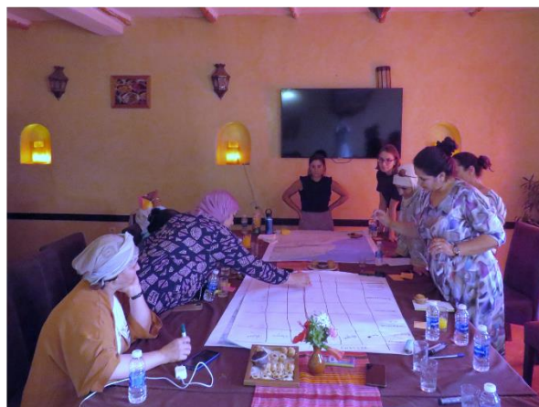
Figure 1. Notre groupe de discussion en action

Le groupe de discussion comprenait trois activités interactives. Dans la première, les participantes/présidentes ont été divisées en deux groupes pour discuter et identifier quatre défis socio-écologiques critiques auxquels sont confrontées les coopératives d'arganiers. Ces défis ont ensuite été présentés et discutés en séance plénière. Dans la deuxième activité, les défis identifiés ont été résumés dans un tableau et chaque participante a voté pour ceux qu'il considérait comme les plus urgents, sur la base de ses perceptions et de ses valeurs. Pour la troisième activité, les participantes ont à nouveau été divisées en deux groupes pour discuter de la question : «Que devrait-on faire et par qui pour surmonter les défis les plus urgents auxquels sont confrontées les coopératives féminines d'arganiers aujourd'hui ?» Des solutions ont été identifiées et présentées lors d'une autre session plénière. Le groupe de discussion a duré environ 1 heure 30 minutes, en français avec traduction de et vers le tamazight. Après accord verbal, il a été enregistré et transcrit en français par un intervenant natif.