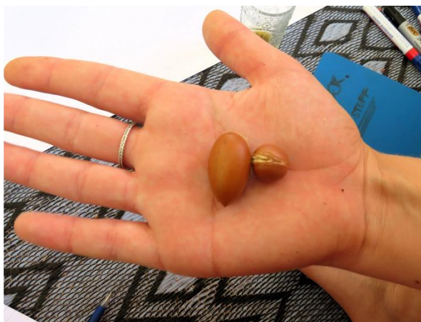
Figure 2. Les noix d'argane et la différence de taille entre une «bonne» année (avec des précipitations suffisantes) et une année sèche (source : Auteurs)