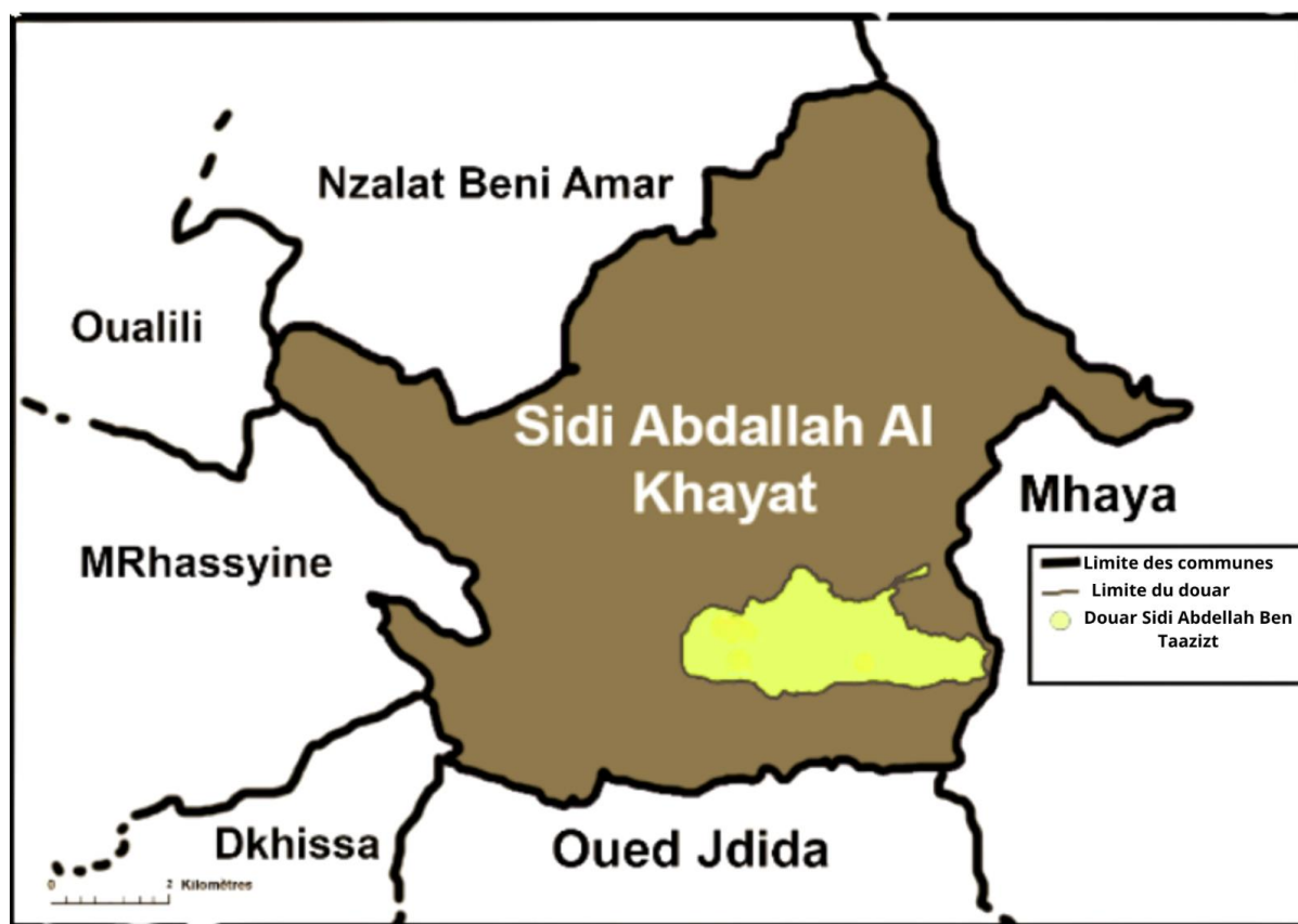
Figure 1. Position du douar au sein de la commune et des communes limitrophes

préfecture de Meknès, au sein de la région Fès-Meknès, constitue notre terrain d'étude. Ce douar fait partie de la petite région naturelle du massif du Zerhoun, région montagneuse mais de faible altitude (1025 m). L'agriculture y est principalement familiale, mais elle connaît de profondes mutations en raison des sécheresses récurrentes, entraînant une transition d'un système agropastoral vivrier vers une agriculture orientée vers les marchés. Cette évolution est également influencée par l'augmentation des besoins sociaux des agriculteurs et par la proximité de la métropole urbaine de Meknès (à environ 15 km). Actuellement, le système de production est largement dominé par l'arboriculture fruitière et le maraîchage (oliviers, grenadiers, pruniers, légumes divers), des cultures consommatrices d'eau d'irrigation.