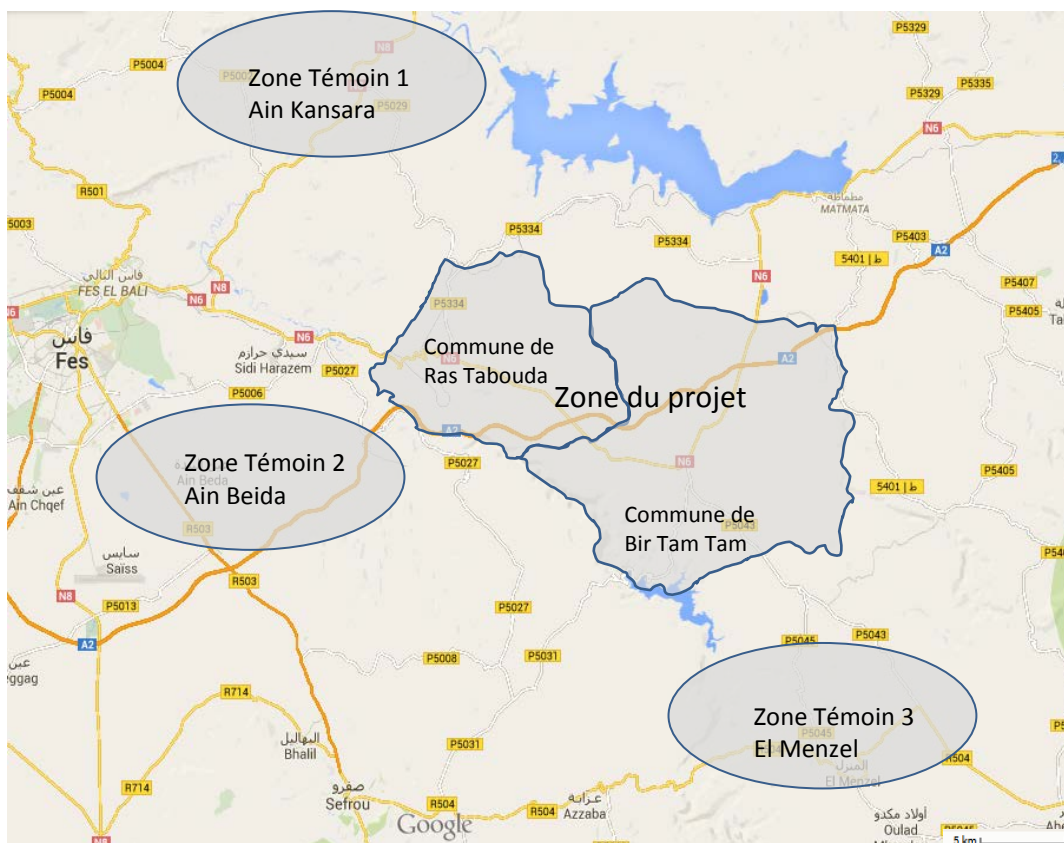
Figure 1. Localisation de la zone du projet et des zones témoins