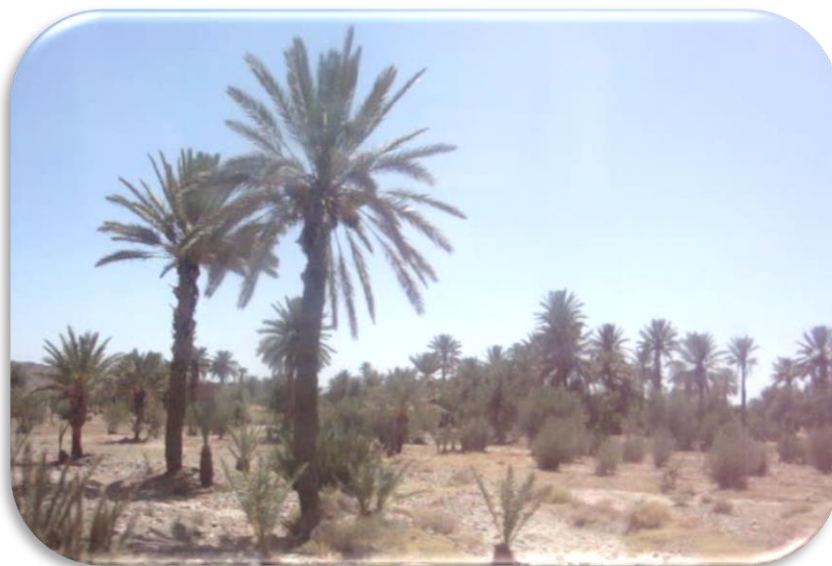
Photo 1. Parcelle où on ne cultive plus que le palmier dattier

Pourtant certains d'entre eux (20%) ont délaissé la céréaliculture et se sont reconvertis à des cultures plus rémunératrices suite à l'équipement de leurs exploitations en systèmes d'irrigation goutte à goutte dans le cadre des subventions accordées par l'ORMVAO. Ainsi, 7% des agriculteurs enquêtés ont introduit les cultures fourragères et 14% d'entre eux ont introduit les cultures maraîchères. Ce sont des agriculteurs qui possèdent d'importantes superficies comparativement à ce qui existe dans la zone (avec une moyenne de 3,5 ha) et qui ont un niveau d'instruction qui leur a permis d'assister à des formations organisées par les acteurs institutionnels. Ce qui montre que ces agriculteurs sont ouverts au progrès technologique et tirent profit de leur environnement institutionnel pour s'adapter aux nouvelles conditions de leur milieu naturel.