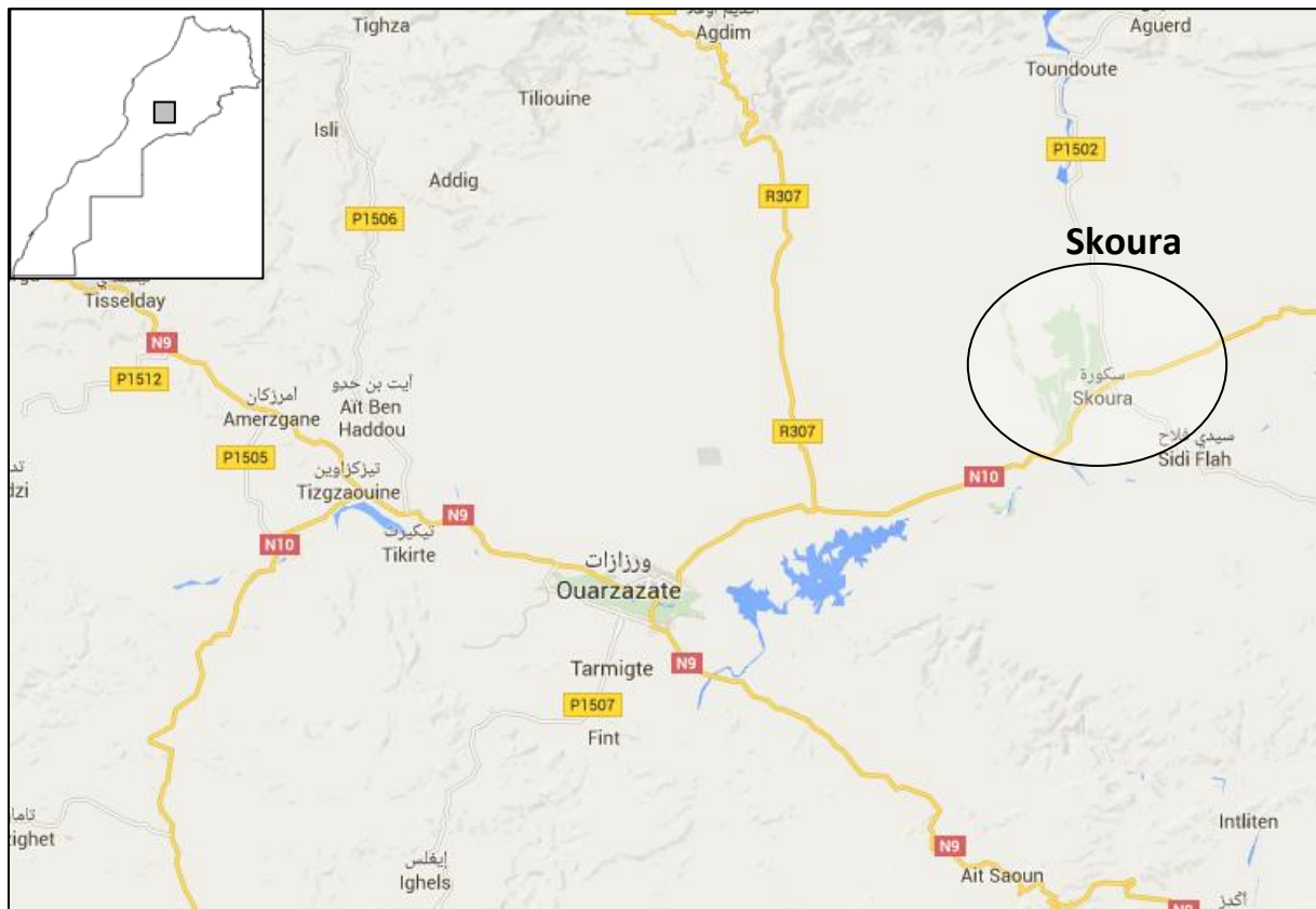
Figure 1 : Situation du centre de Skoura

Sur l'année, la température moyenne à Skoura est de 18,0 °C et la précipitation moyenne est de 171 mm (Figure 2). Le mois le plus sec est Juillet avec une moyenne de 2 mm. En Novembre, les précipitations sont les plus importantes de l'année avec une moyenne de 28 mm.