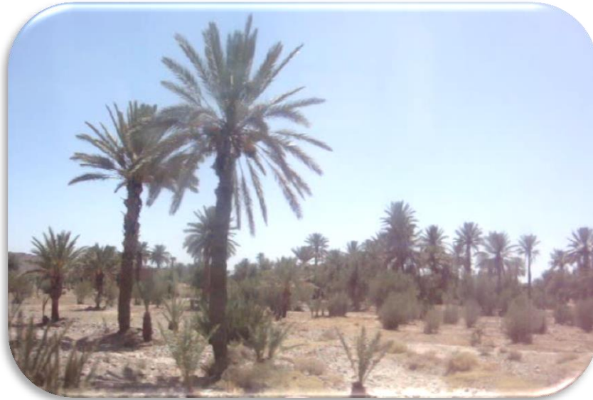
Photo 1. Parcelle où on ne cultive plus que le palmier dattier

Pourtant certains d'entre eux (20%) ont délaissé la céréaliculture et se sont reconvertis à des cultures plus rémunératrices suite à l'équipement de leurs exploitations en systèmes d'irrigation goutte à goutte dans le cadre des subventions accordées par l'ORMVAO. Ainsi, 7% des agriculteurs enquêtés ont introduit les cultures fourragères et 14% d'entre eux ont introduit les cultures maraîchères. Ce sont des agriculteurs qui possèdent d'importantes superficies comparativement à ce qui existe dans la zone (avec une moyenne de 3,5 ha) et qui ont un niveau d'instruction qui leur a permis d'assister à des formations organisées par les acteurs institutionnels. Ce qui montre que ces agriculteurs sont ouverts au progrès technologique et tirent profit de leur environnement institutionnel pour s'adapter aux nouvelles conditions de leur milieu naturel.