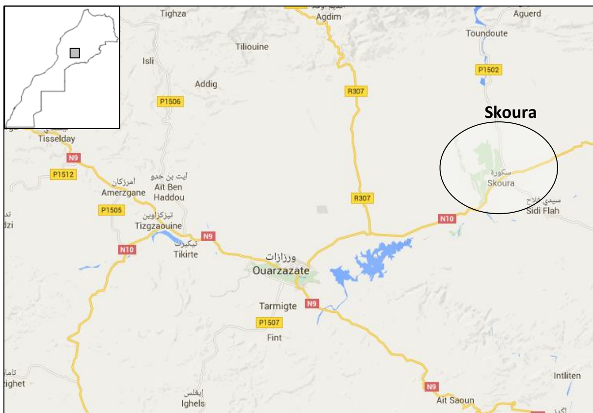
Figure 1 : Situation du centre de Skoura

Sur l'année, la température moyenne à Skoura est de 18,0 °C et la précipitation moyenne est de 171 mm (Figure 2). Le mois le plus sec est Juillet avec une moyenne de 2 mm. En Novembre, les précipitations sont les plus importantes de l'année avec une moyenne de 28 mm.