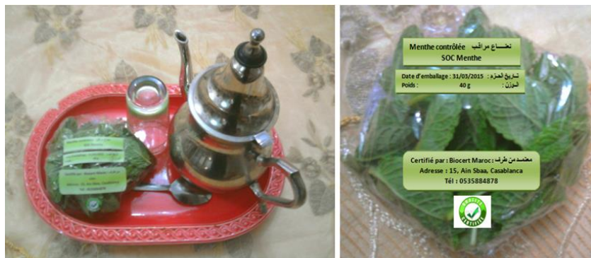
Photos 1. Montage photo d'un sachet individuel de menthe de qualité garantie