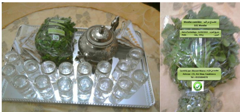
Photos 2. Montage photo d'une robta de menthe d'agriculture de qualité garantie

Pour illustrer notre démarche, des photomontages ont été utilisés pour représenter ce que pourrait être un sachet de botte de menthe pour une consommation individuelle au café et pour une robta de menthe de