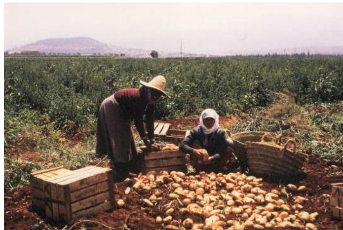
Photo 2. Ramassage des pommes de terre par les femmes