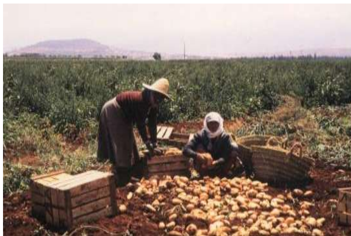
Photo 2. Ramassage des pommes de terre par les femmes