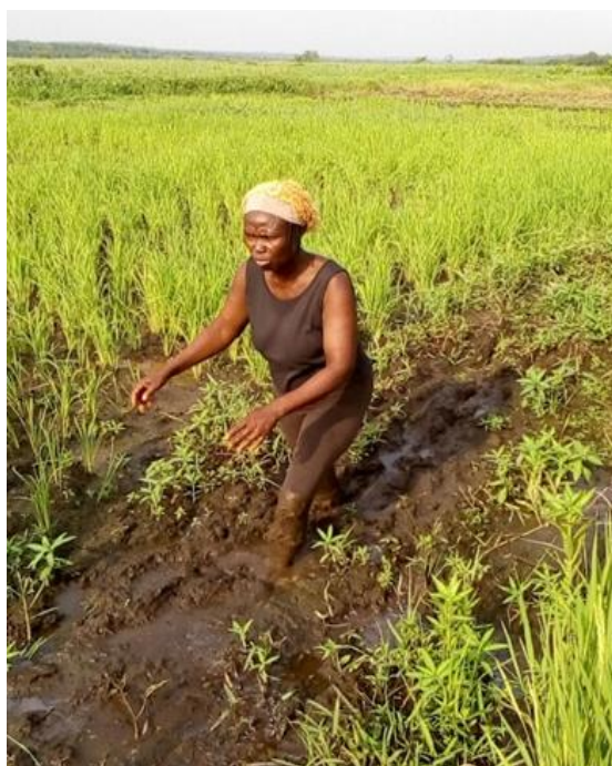
Photo 1. productrice de riz (Glazoué, département des Collines, Juillet 2018)

Le présent article vise à répondre à ces questions et teste l'hypothèse selon laquelle les contrats affectent différemment les hommes et les femmes. Après avoir examiné l'inclusion ou non des femmes aux contrats agricoles, l'article analyse et compare l'impact des contrats sur les riziculteurs hommes à celui des femmes productrices de riz.