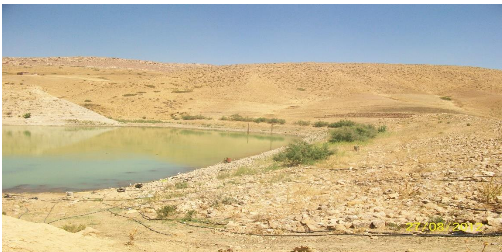
Photo : retenue collinaire, Saneg, Médéa, 2012.

Cette ébauche de forme d'organisation collective échappe totalement à l'administration, d'autant plus que la retenue est éloignée du chef-lieu de wilaya d'une centaine de kilomètres, et l'administration ne fait que constater un fait établi.