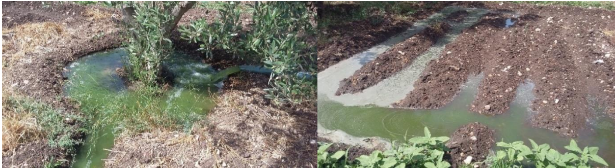
Photos 1. Irrigation en gravitaire d'oliviers et de maïs fourrager, à partir des effluents pompés à l'aide d'une motopompe

station 20 . L'irrigation localisée n'étant pas encore installée, c'est l'irrigation gravitaire qui est aujourd'hui utilisée par ces agriculteurs (cf. Photos 1). De grandes quantités d'eau sont lâchées et l'irrigation s'effectue en continu, toute la journée durant.