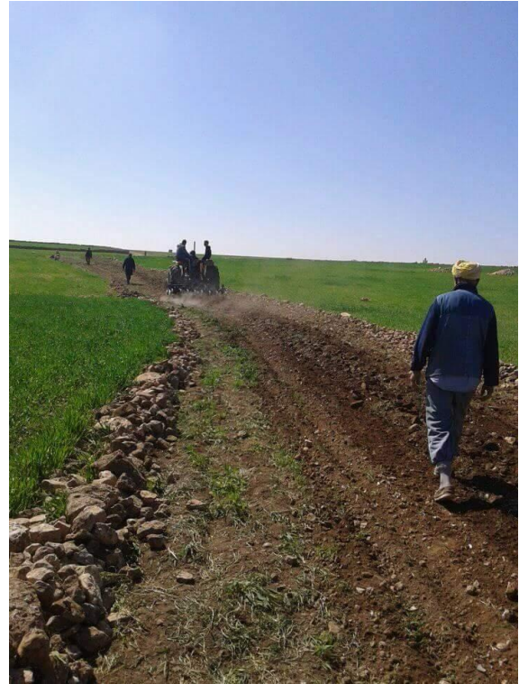
Photo 3. Passage d'un tracteur pour libérer une voie