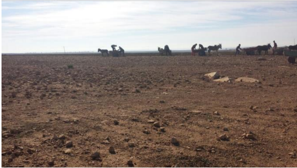
Photo 2. Mobilisation des chariots individuels pour dépierrage