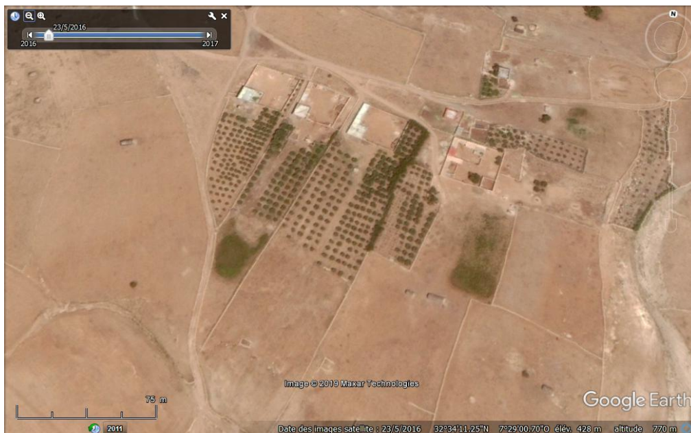
Photo 4. Avant arrachage des oliviers