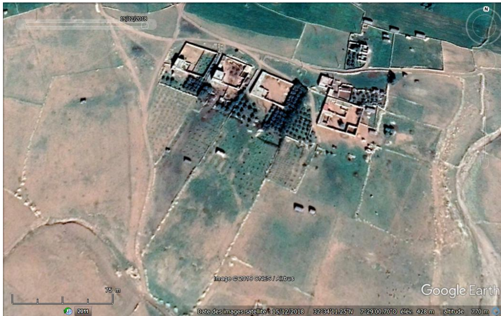
Photos 6. Délimitation des terres récupérées au Sud et à l'Est du village après le mouvement