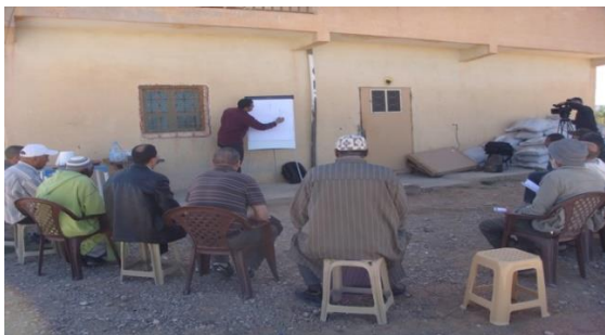
Photo 1. Session de formation sur la fertilisation du palmier dattier, PI Tineidade

une fluidité dans les discussions. Ils ont plus apprécié le caractère pratique de la formation qui leur a permis de comprendre que faire et comment le faire. En effet, pour la fertilisation organique, ils se sont exercés sur le calcul des quantités de compost à apporter par pieds. Pour la lutte contre la cochenille, ils ont appris les méthodes de lutte, le produit à utiliser et l'époque de son application. Ce qui montre que la PI est un espace de conseil rapproché relatif à de nouvelles techniques et de formation de ses membres.