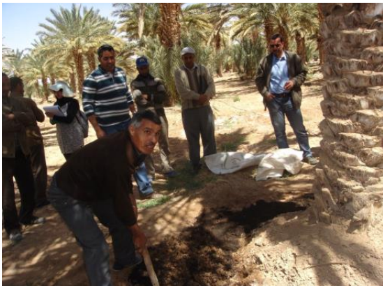
Photo 2. Application du compost, PI d'Erfoud

Les résultats de l'enquête réalisée ont montré que 88 % des enquêtés étaient satisfaits du déroulement des essais car les parcelles répondaient aux critères de sélection retenus et les membres (phoeniculteurs et institutionnels) s'impliquaient activement traduisant la volonté de « faire ensemble » pour la réussite de cette expérimentation.