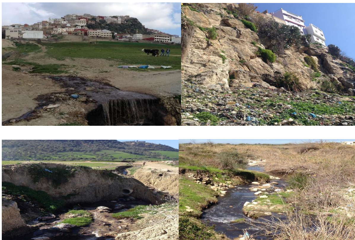
Photos illustrant les formes de dégradation des ressources naturelles

20% des enquêtés font le lien direct entre la diminution des rendements agricoles et la dégradation des ressources naturelles. En effet, l'agriculture de Moulay Driss Zerhoun est une agriculture traditionnelle. La dépendance vis-à-vis les conditions climatiques, l'érosion des sols et l'utilisation non raisonnée des fertilisants et des pesticides entraînent des pertes dans les rendements des cultures.