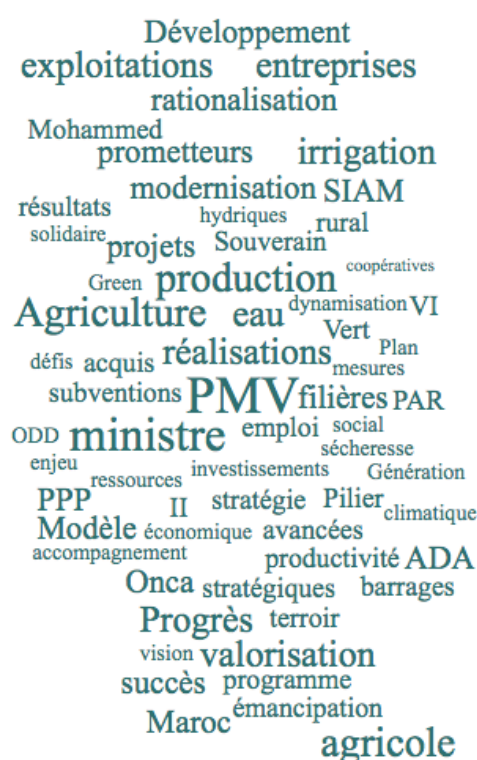
Figure 1: Nuage des principaux mots-clés des articles du quotidien Le Matin traitant du PMV entre 2016 et 2020

Le nuage de mots ci-dessus généré par le logiciel Iramuteq (Figure 1) met en grands caractères les mots qui se répètent le plus dans les articles étudiés du quotidien Le Matin. Tenant compte du nuage de mots et, de surcroît, d'une lecture des 16 articles en question, il s'avère que le focus est généralement mis sur les discours institutionnels tels que ceux de l'Agence pour le Développement Agricole (ADA), de l'Office National du conseil Agricole (ONCA) ou encore du Ministère de l'Agriculture, de la Pêche Maritime, du Développement Rural et des Eaux et Forêts.