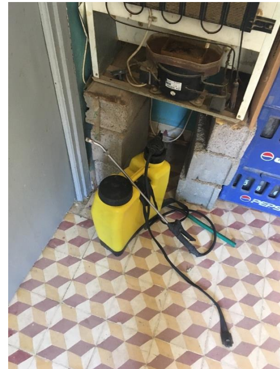
Photos 3. Pulvérisateurs à dos installés dans un café et suspendus dans une maison

des problèmes de respiration. Il est évident que, vu les moyens limités au niveau du dispensaire, la détection et le diagnostic de ces intoxications par les pesticides restent très difficiles.