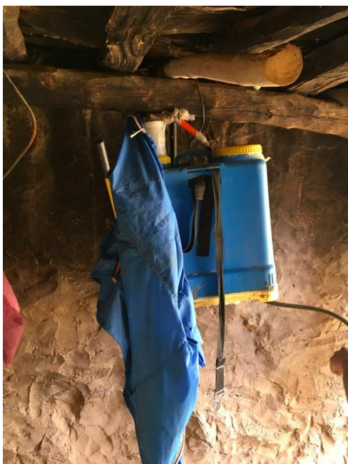
Tableau 3. Méthode d'application des pesticides (n=60)*