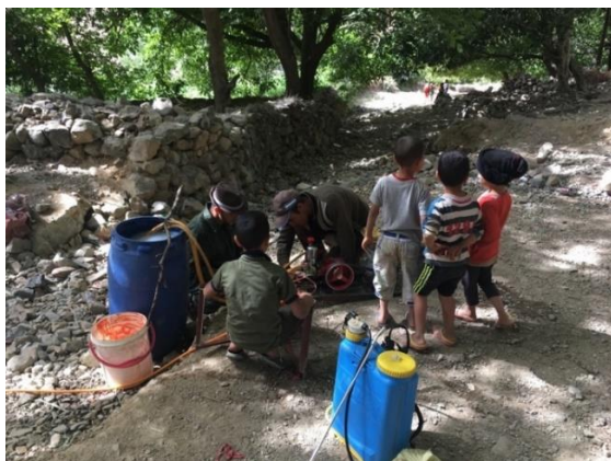
Photo 2. Agriculteurs installant du matériel de pulvérisation de pesticides sous les yeux des enfants